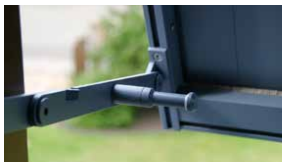
Différentes versions de projection disponibles en option